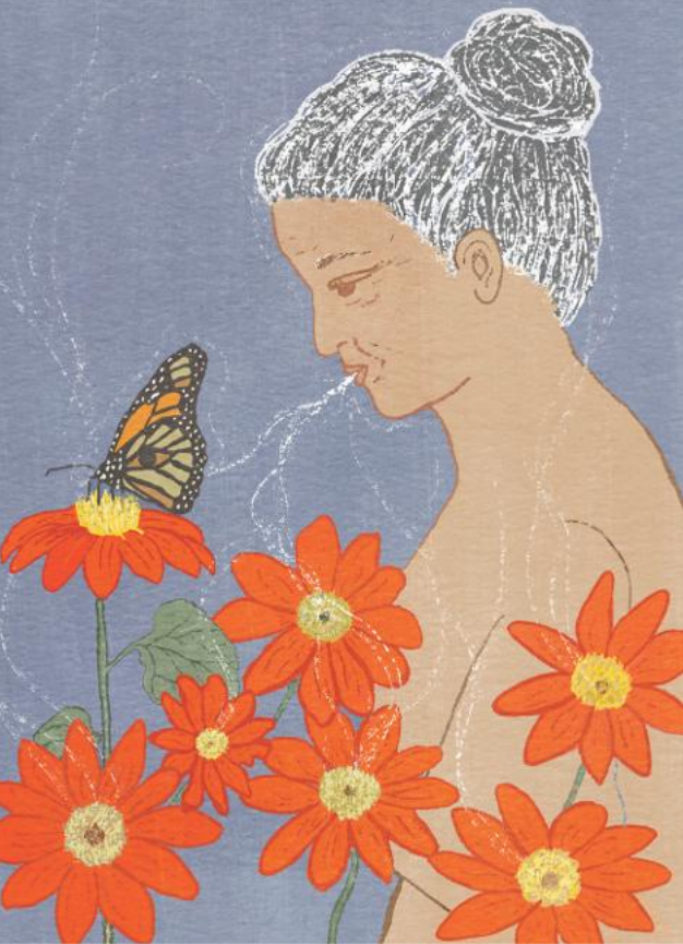
32. Mexicaanse zonnebloem